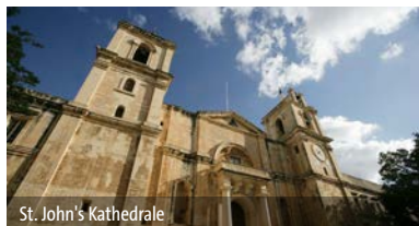
St. John's Kathedrale

zubuchbar in Verbindung mit dem Angebot „Reisen mit Legenden“ für € 155 pro Person