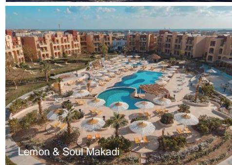
Lemon & Soul Makadi