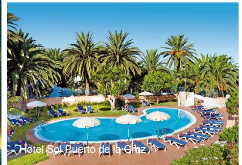
Hotel Sol Puerto de la Cruz